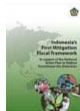
Kerangka fiskal untuk mitigasi perubahan iklim