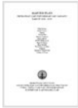
Master plan penelitian dan pengembangan Gaharu tahun 2013 - 2023