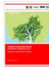
Tingkat emisi rujukan ( reference emission level ) provinsi Kalimantan Tengah