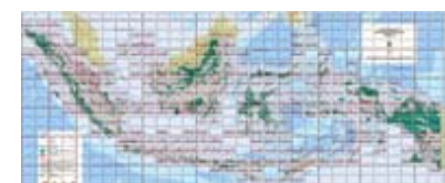
Geodatabase Peta Indikatif Penundaan Pemberian Izin Baru revisi 3, Zip format