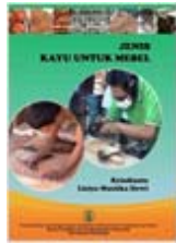
Jenis kayu untuk mebel