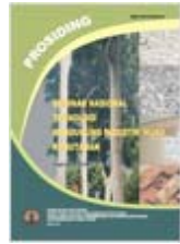
Prosiding: Teknologi mendukung industri hijau kehutanan