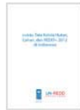
Indeks tata kelola hutan, lahan, dan REDD+ 2012 di Indonesia