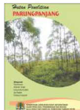
Hutan Penelitian Parungpanjang