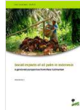
Social impacts of oil palm in Indonesia: A gendered perspective from West Kalimantan