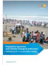
Population Dynamics and Climate Change in Indonesia: Mobilizing for a Sustainable Future