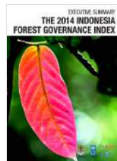
Executive Summary The 2014 Indonesia Forest Governance Index