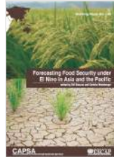
Forecasting Food Security under El Nino in Asia and the Pacific