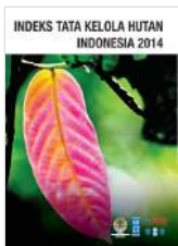
Indeks Tata Kelola Hutan Indonesia 2014