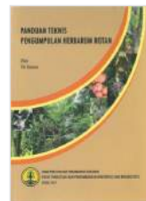
Panduan Teknis Pengumpulan Herbarium Rotan

Jika anda mengalami masalah dengan format email ini, klik di sini untuk format PDF. Kami mengharapkan umpan balik dan saran anda berkenaan dengan REDD-Indonesia dan berbagai laporan penting yang kami muat dalam edisi ini. Kirimkan masukan anda ke pengelola situs REDD-Indonesia .