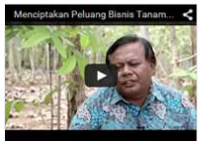
Menciptakan Peluang Bisnis Taman Kayu Rakyat