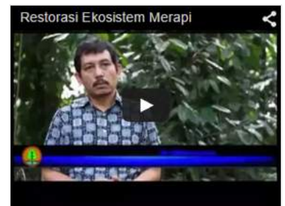
Restorasi Ekosistem Merapi