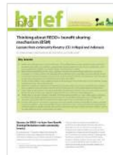
Thinking About REDD+ Benefit Sharing Mechanism (BSM): Lessons From Community Forestry (CF) in Nepal and Indonesia