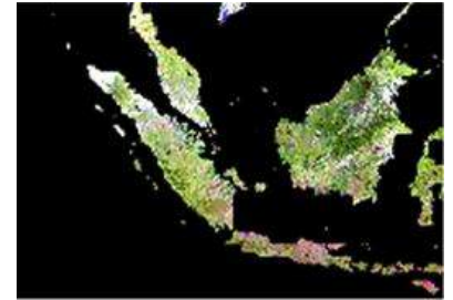
Peta Geospasial Indonesia