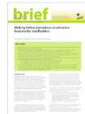
Making Timber Plantations an Attractive Business for Smallholders