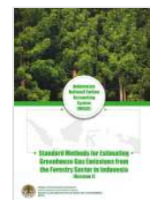
Standard Methods for Estimating Greenhouse Gas Emissions from the Forestry Sector in Indonesia (Version 1)