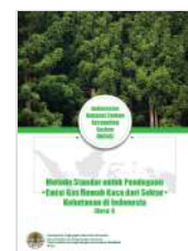
Metode Standar untuk Pendugaan