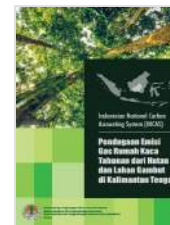
Pendugaan Emisi Gas Rumah Kaca Tahunan dari Hutan dan Lahan Gambut di Kalimantan Tengah