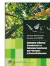
Estimation of Annual Greenhouse Gas Emissions from Forest and Peat Lands in Central Kalimantan