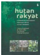
Hutan Rakyat - Sumbangsih Masyarakat Pedesaan untuk Hutan Tanaman