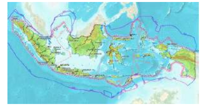
Geodatabase Peta Indikatif Penundaan Pemberian Izin Baru revisi 3, Zip format

Emisi Gas Rumah Kaca dari Sektor Kehutanan di Indonesia (Versi 1)