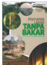
Penyiapan Lahan Tanpa Bakar untuk Penanaman