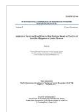
Analysis of Forest and Land Fires in Riau Province Based on The Use of Land for Mitigation of Smoke Disaster