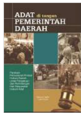
Adat di Tangan Pemerintah Daerah