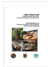
Timber Based Industry in South Kalimantan Province