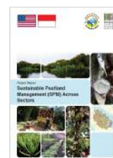
Sustainable Peatland Management (SPM) Across Sectors