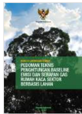
Pedoman Teknis Penghitungan Baseline Emisi dan Serapan Gas Rumah Kaca Sektor Berbasis Lahan