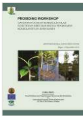
Lokasi Penanaman Kembali, Jumlah Kebutuhan Bibit dan Skema Penanaman Berkelanjutan Jenis Ramir