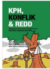
KPH, Konflik dan REDD