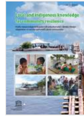
Local and Indigenous Knowledge for Community Resilience