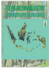
Atlas Jenis-Jenis Pohon Andalan Setempat Untuk Rehabilitasi Hutan dan Lahan di Indonesia