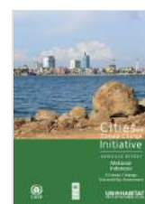
Cities and Climate Change Initiative Abridged Report Makassar