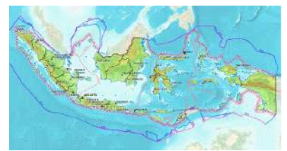
Geodatabase Peta Indikatif Penundaan Pemberian Izin Baru revisi 3, Zip format