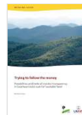
Trying to follow the money: Possibilities and limits of investor transparency in Southeast Asia's rush for "available" land