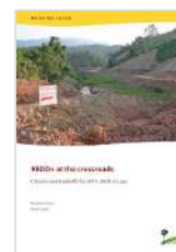
REDD+ at the crossroads: Choices and tradeoffs for 2015 – 2020 in Laos