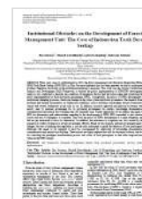
Institutional Obstacles on the Development of Forest Management Unit: The Case of Indonesian Tasik Besar Serkap