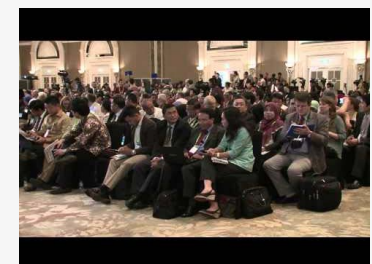
Forests Asia Summit 2014, Sangrila Hotel 5 Mei 2014