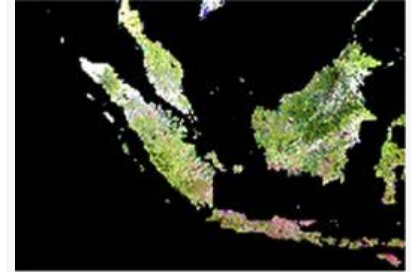
Peta Geospasial Indonesia