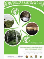
Pembelajaran Praktis: Sekolah Lapangan Budidaya dan Pemasaran Karet