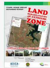
LAND REHABILITATION IN EXTREME ZONE-Learning from A/R CDM in East Lombok