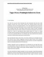
Tugas Utama Pemimpin Indonesia Baru