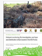
Hotspot monitoring, fire investigation, and type and distribution of land assets in the KFCP area