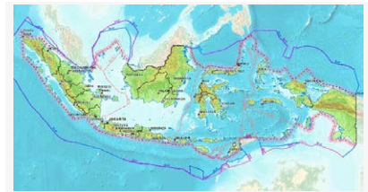
Geodatabase Peta Indikatif Penundaan Pemberian Izin Baru revisi 3, Zip format

Monitoring Hotspot dan Investigasi Kebakaran di Wilayah Kerja KFCP