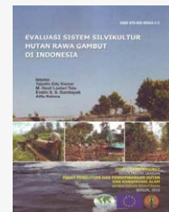
Evaluasi Sistem Silvikultur Hutan Rawa Gambut di Indonesia