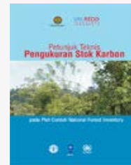
Petunjuk teknis pengukuran stok karbon pada plot contoh national forest inventory