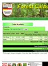
Forest carbon accounting: Software