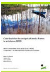
Code book for the analysis of media frames in articles on REDD