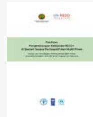
Panduan pengembangan kebijakan REDD+