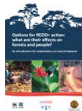
Options for REDD+ action: what are their effects on forests and people?