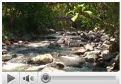
Belajar membuat konsensus FPIC di Lembah Mukti, kabupaten Donggala, Sulawesi Tengah