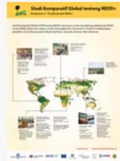
Studi Komparatif Global tentang REDD+ Komponen 2