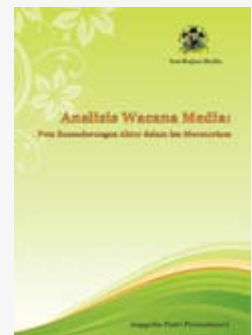
Analisis Wacana Media: Peta Kecenderungan Aktor dalam Isu Moratorium