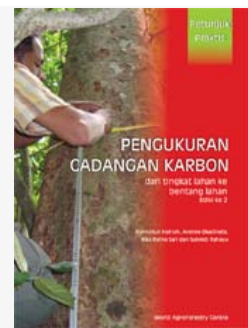
Pengukuran cadangan karbon dari tingkat lahan ke bentang lahan