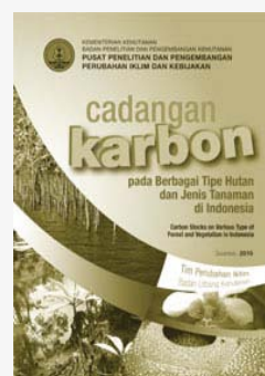
Cadangan Karbon pada berbagai tipe hutan dan