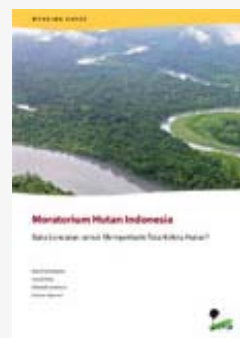
Moratorium hutan Indonesia