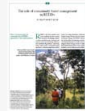
The role of community forest management in REDD+