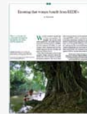
Ensuring that women benefit from REDD+