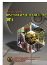
Data dan Informasi Kesatuan Pengelolaan Hutan 2012