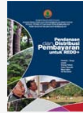
Pendanaan dan Distribusi Pembayaran untuk REDD+

mata pencaharian sosial-ekonomi dan hak dan kepemilikan lahan untuk digunakan dalam perencanaan penggunaan lahan kolaboratif yang berbasis ekosistem