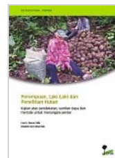
Perempuan, Laki-Laki dan Penelitian Hutan: Kajian atas pendekatan, sumber daya dan metode untuk menangani jender