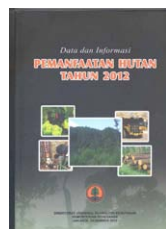
Data dan Informasi Pemanfaatan Hutan Tahun 2012