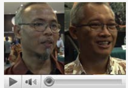
Penguatan Kapasitas Kesatuan Pengelolaan Hutan (KPH) dan REDD+